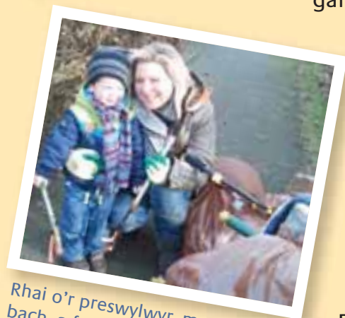
Rhai o'r preswylwyr, mawr a bach, a fu'n helpu