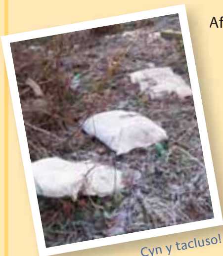
Cyn y tacluso!

Diolch yn fawr i'r holl breswylwyr a helpodd i drefnu'r tacluso ac a fu'n gweithio'n galed iawn i sicrhau gwelliant mor fawr i'w stad.